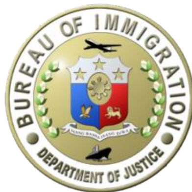
フィリピン入国管理局

フィリピンの外国人登録書です。59日間以上滞在する学生は、必ず取得しなければならず1年間は無効です。フィリピン国内では身分証明書としても利用できます。ACR-I Cardの取得手続きは当校で行います。